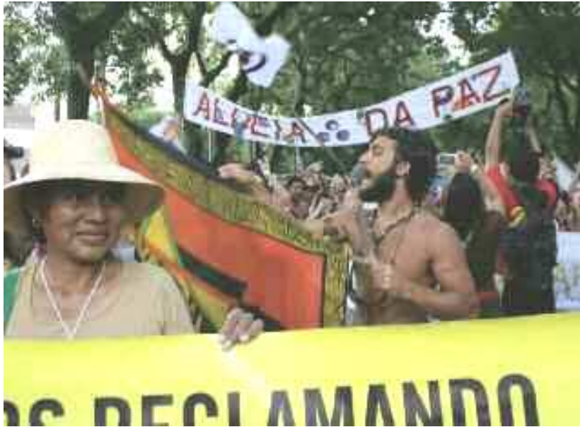
Vertreter der Yakye Axa und Sawhoyamaxa beim Weltsozialforum in Belém, Brasilien, Februar 2009

“Das Erste was ich meiner Gemeinschaft bei meiner Rückkehr sagen werde, ist, dass viele Männer und Frauen von allen Teilen der Welt an Veranstaltungen teilnahmen, bei denen wir Gelegenheit hatten, über unseren Fall und unseren Kampf zu erzählen und dass sie uns alle unterstützten.”