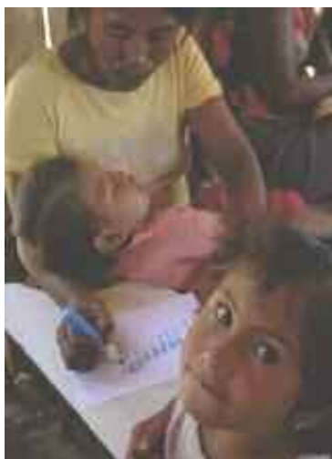
Interamerikanischer Gerichtshof für Menschenrechte, Yakye Axa Urteil, Juni 2005

“Man muss die enge Verbindung der indigenen Völker mit dem Land als Grundlage ihrer Kultur, ihres spirituellen Lebens, ihrer ganzheitlichen Vorstellungen, ihres wirtschaftlichen Überlebens, sowie als Basis für deren Erhaltung und Weitergabe an zukünftige Generationen erkennen und verstehen.”