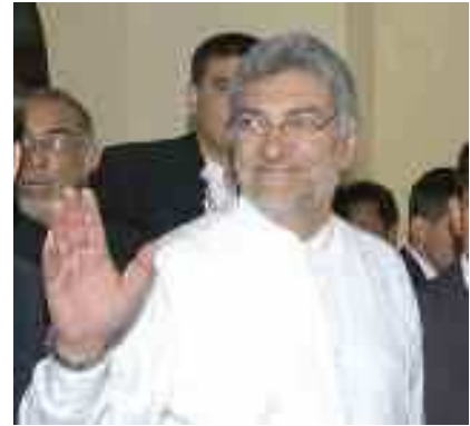
Fernando Lugo