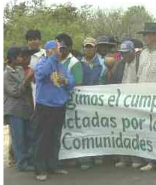
Oben: Demonstration der Yakye Axa und der Sawhoyamaxa, bei der die Rückgabe des angestammten Landes verlangt wird.

Die Yakye Axa und Sawhoyamaxa erhoben unabhängig von einander Ansprüche auf Gebiete, mit denen sie