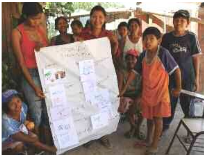
Yakye Axa und Sawhoyamaxa erläutern ihre Sorgen in den Workshops von Amnesty International, die durch Tierraviva ermöglicht wurden. Alle Fotos © Natalia Godoy, sofern nichts anderes angegeben ist.

“Ausbildung ist wichtig, damit unsere Kinder neue Fähigkeiten erwerben können, das Internet benutzen können und Zugang zu den gleichen Möglichkeiten haben wie die Paraguayer, damit diese nicht länger sagen können, die indigenen Bewohner sind dumm und unwissend.”